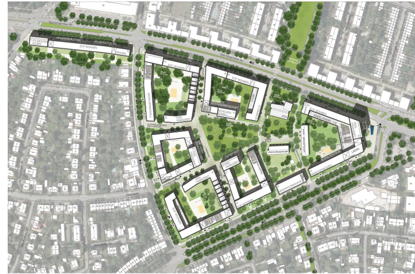
Delaossa + Grassinger/Emrich +nrt