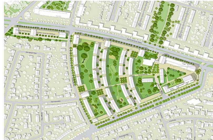
Zillerplus + Lex Kerfers