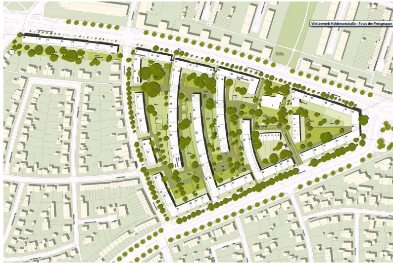
Steidle + Lohrer Hochrein