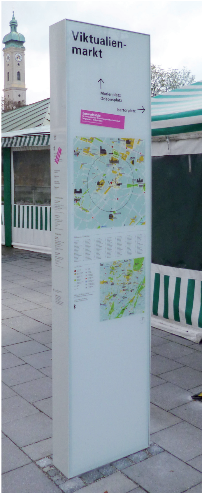
Detailansicht - Planausrichtung Norden