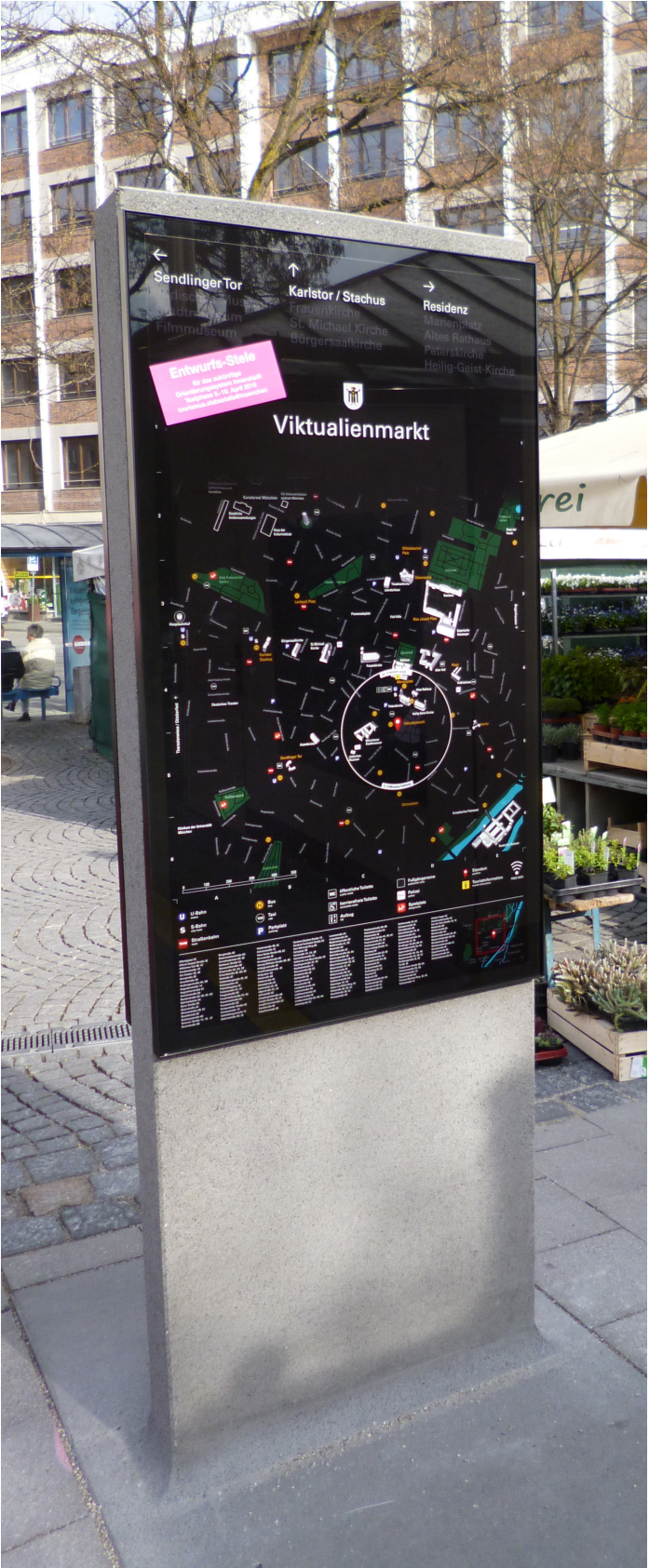
Detailansicht - Planausrichtung beidseitig Norden