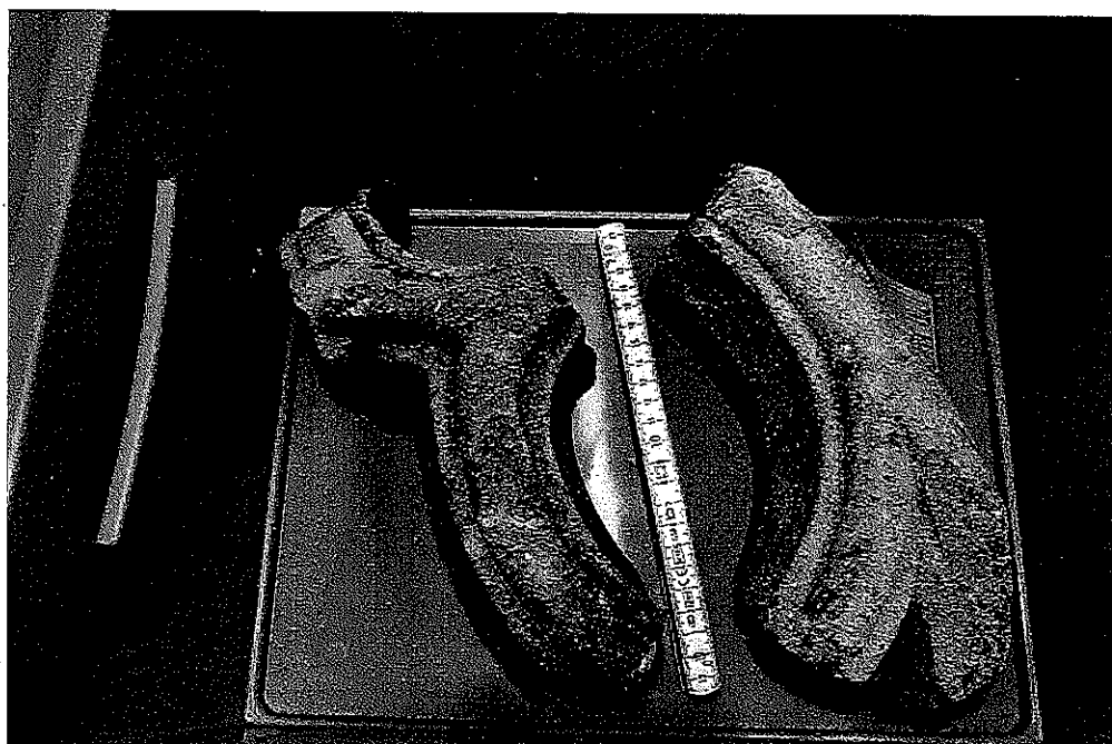
Untersuchungen Hackenstraße 7, 2014/2015, Maßwerkfragmente, spätes 15./frühes 16. Jh..