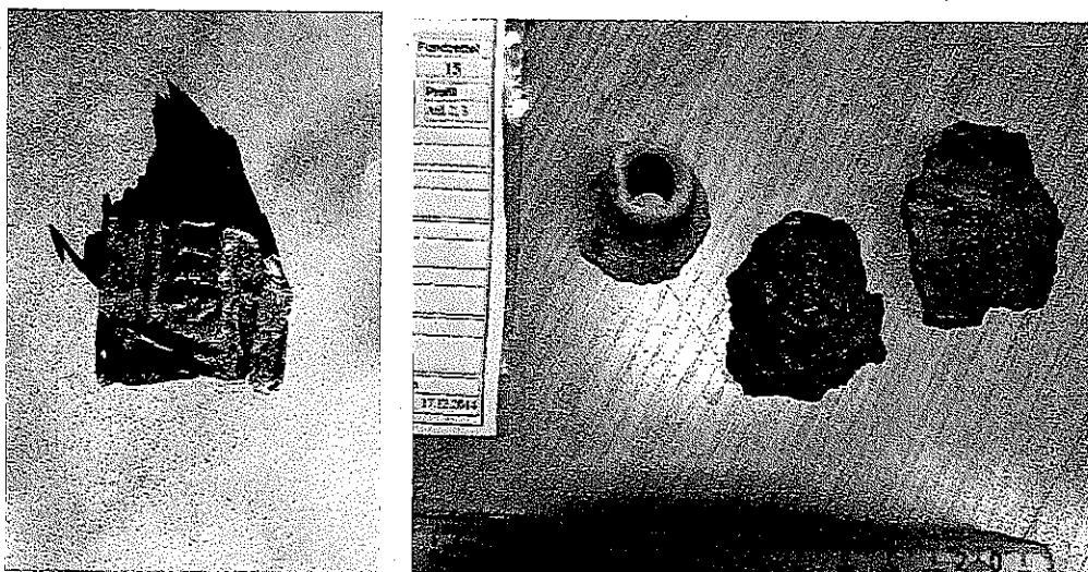
Untersuchungen Hackenstraße 7, 2014/2015. Spätgotischer Buchbeschlag (links), bronzezeitliche Keramik und hochmittelalterliche Ausgusstülle eines Schankgefäßes (12. Jh., rechts).