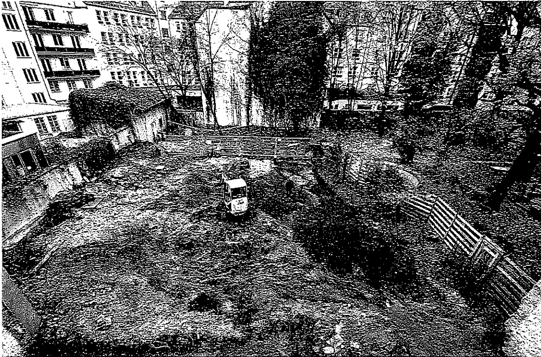
Untersuchungen Hackenstraße 7 2014/2015 Überblick.