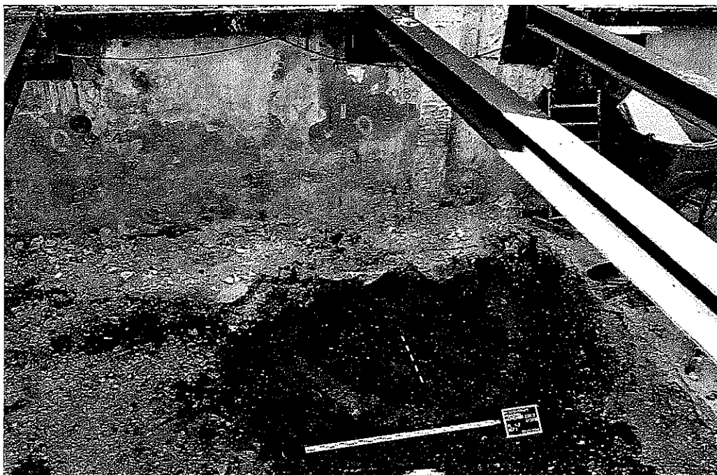
Untersuchungen Altheimer Eck 3. Brunnen und Latrinenebefund unter dem Kellerboden der Bebauung aus den 60er Jahren des 20. Jahrhunderts..