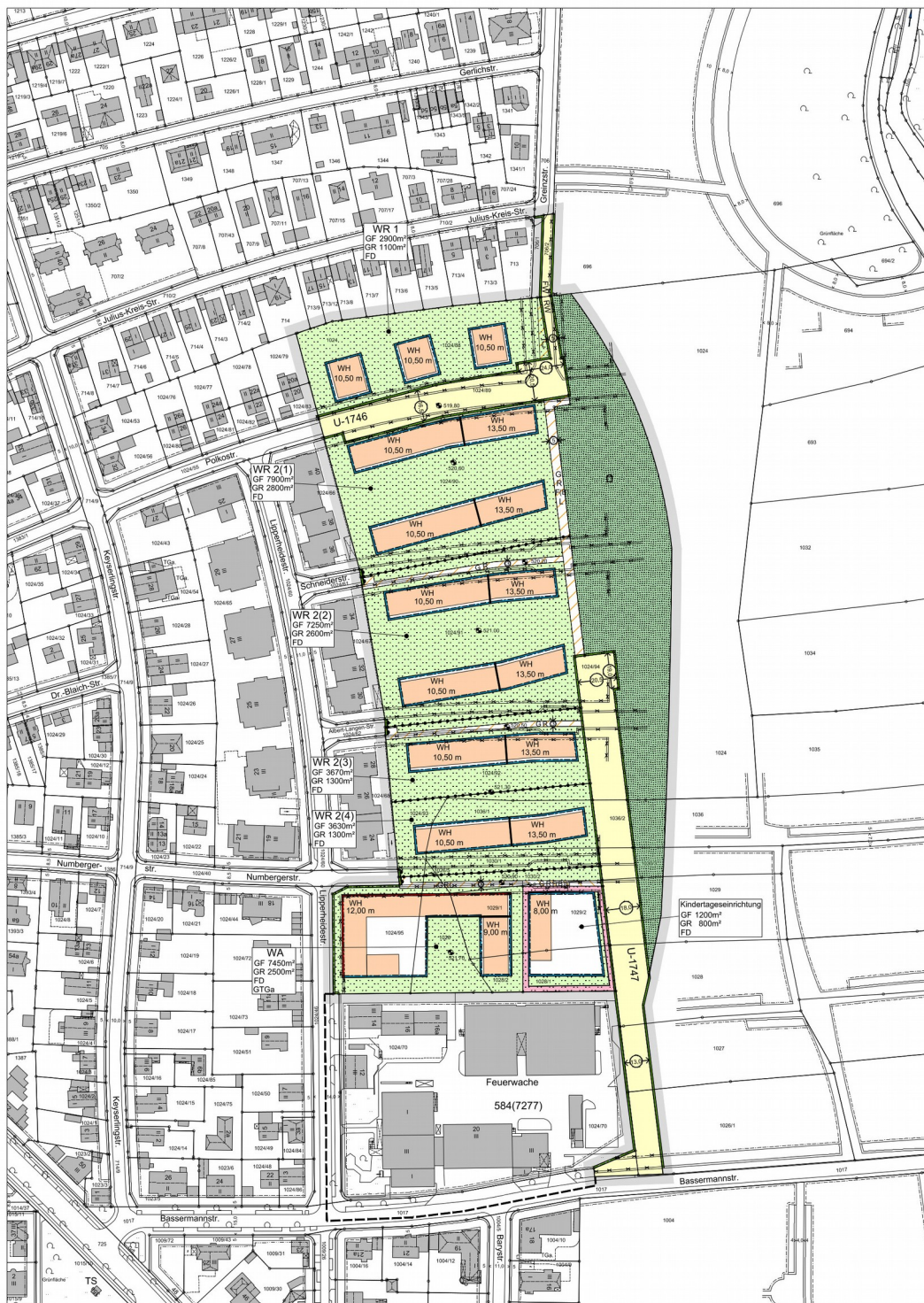
Bebauungsplan mit Grünordnung Nr. 1507a der Landeshauptstadt München

BEREICH: Lipperheidestraße (östlich) zwischen Greinzstraße und Bassermannstraße