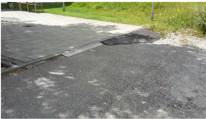
Auffahrt zur seniorenrechten Wohnanlage