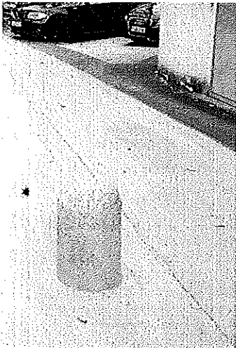
Taubenhofweg, fünf fast unsichtbare Betonpoller