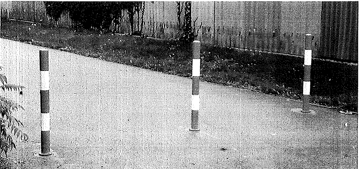
Verbindung Hasenthalweg Distlhofweg gut sichtbar