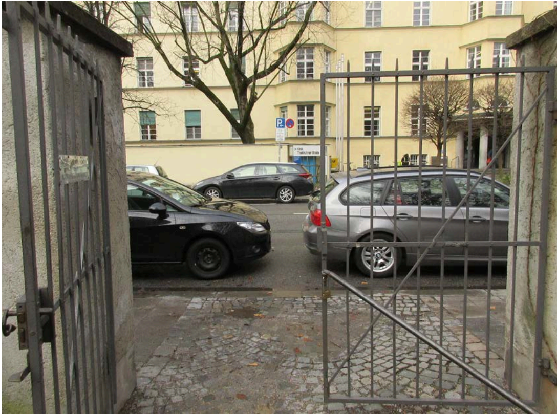
Sicht Richtung Klink