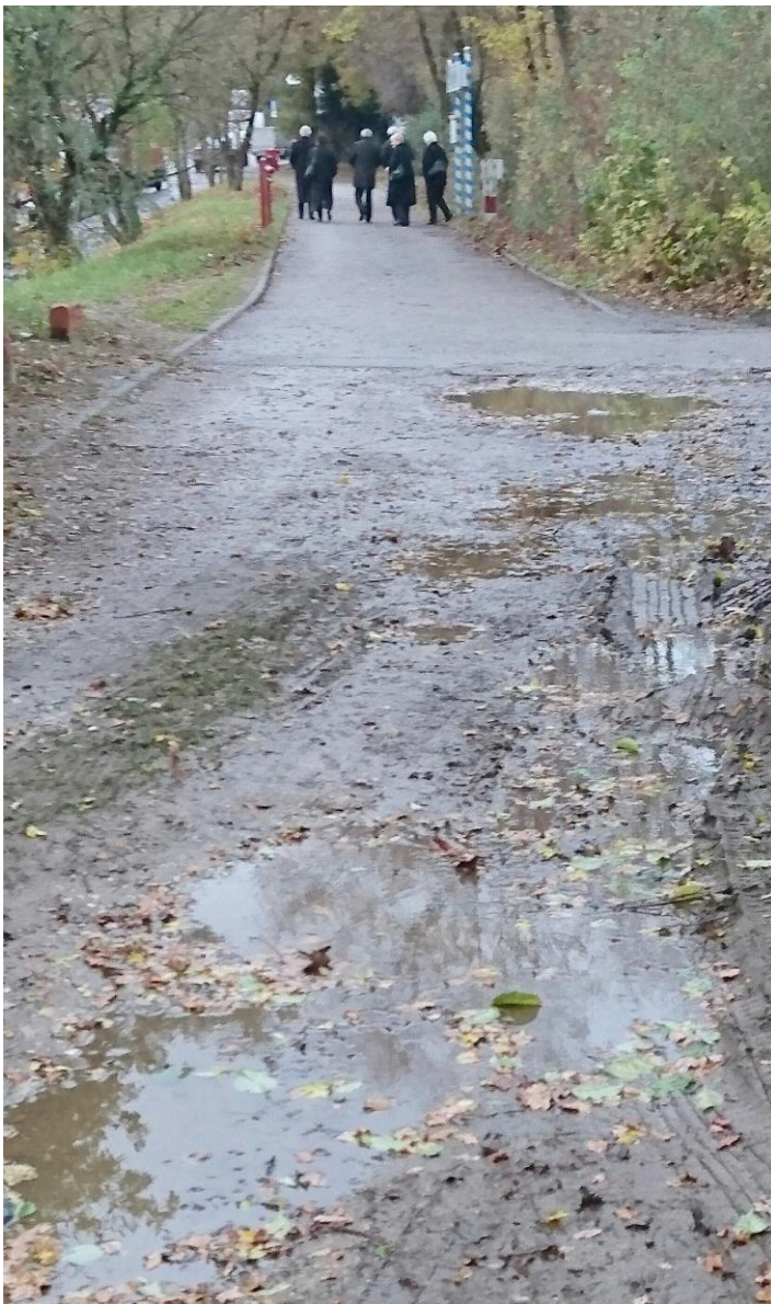
Fußwegzeichen an der Garmischer Straße