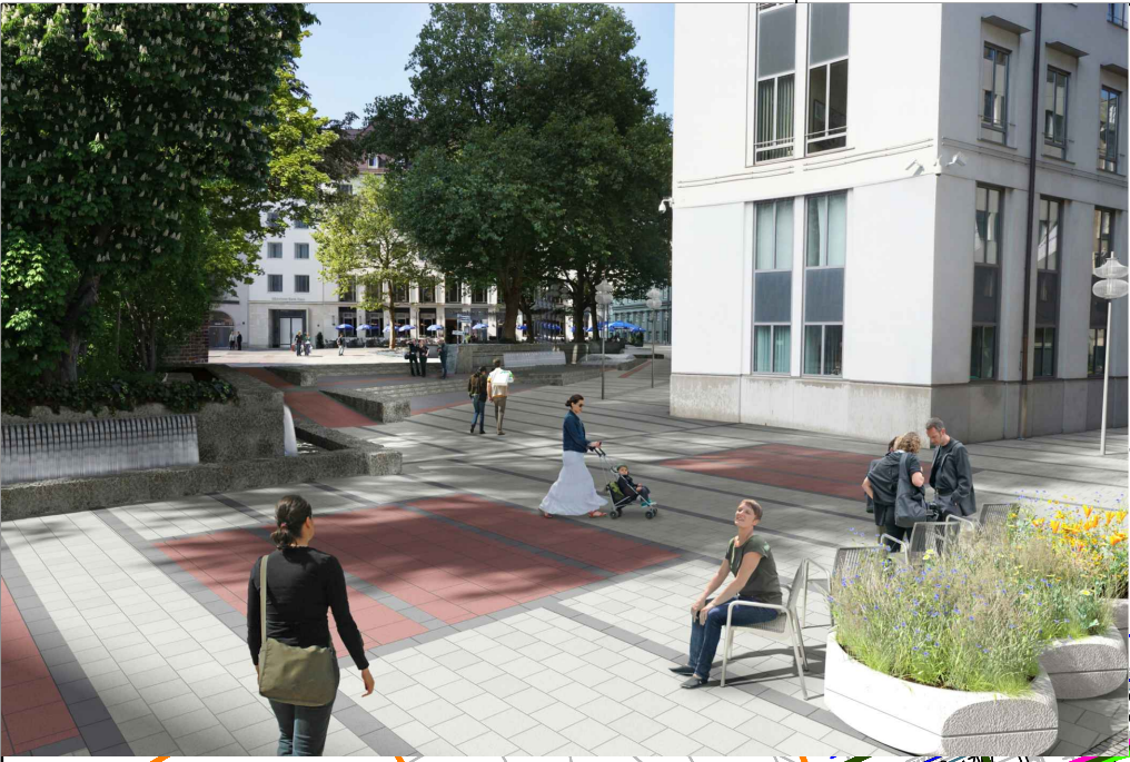
VISUALISIERUNG BILD 2