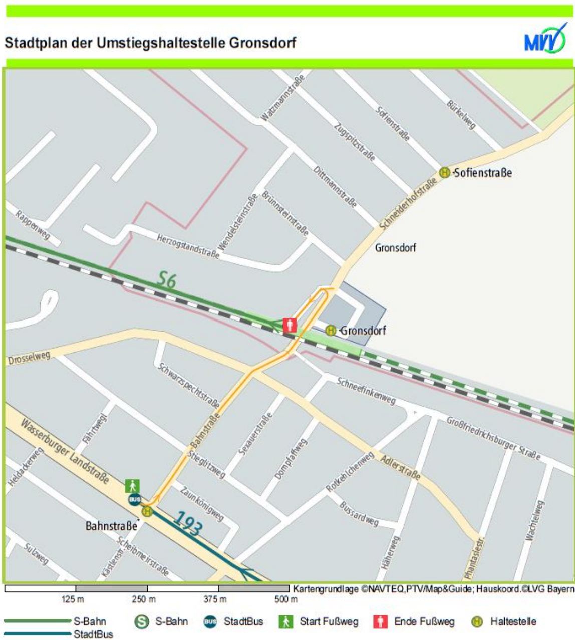
Abb. 2: Umsteigefußweg 193 -> S4/S6 Bahnstraße – Gronsdorf