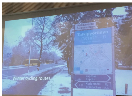
Winterdienst Turku, Foto: privat