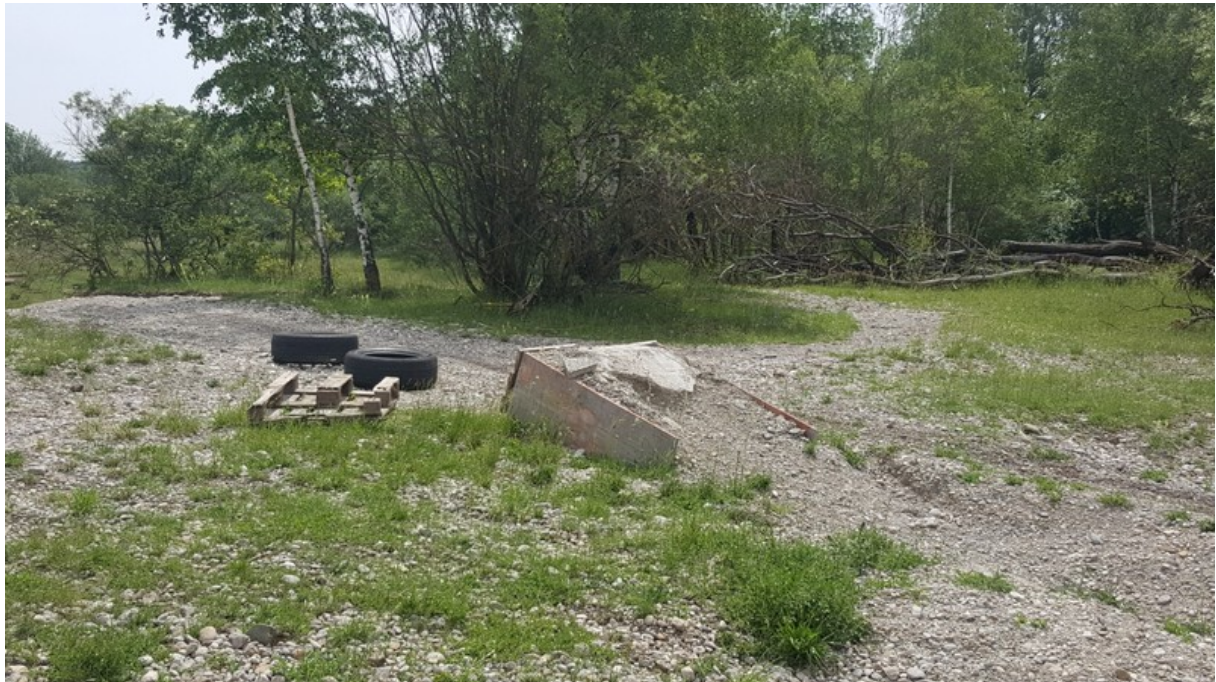
Blick in das Gelände auf eine künstlich angelegte Sprungschanze sowie Hindernisse.