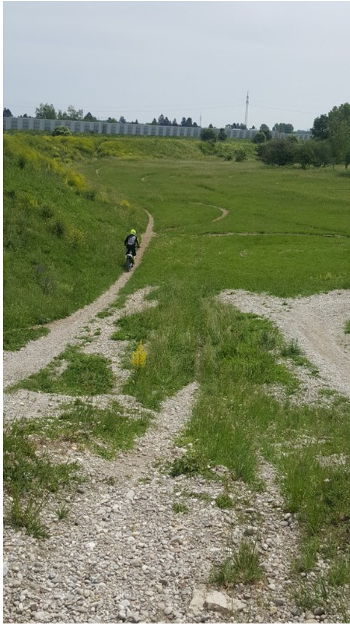
Blick in das Gelände mit den künstlich angelegten Fahrspuren. Im Hintergrund ist die Lärmschutzwand zur Autobahn zu sehen.