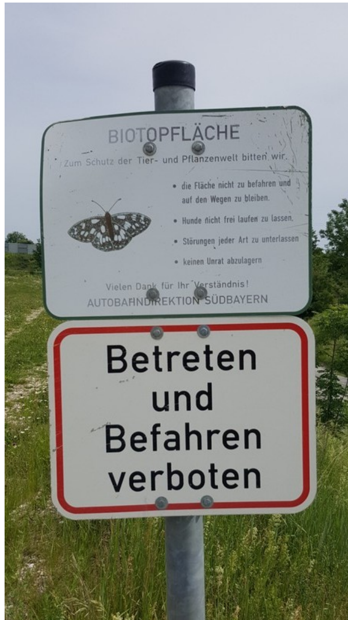
Beschilderung am Zugang zur Ausgleichsfläche auf der Ostseite.