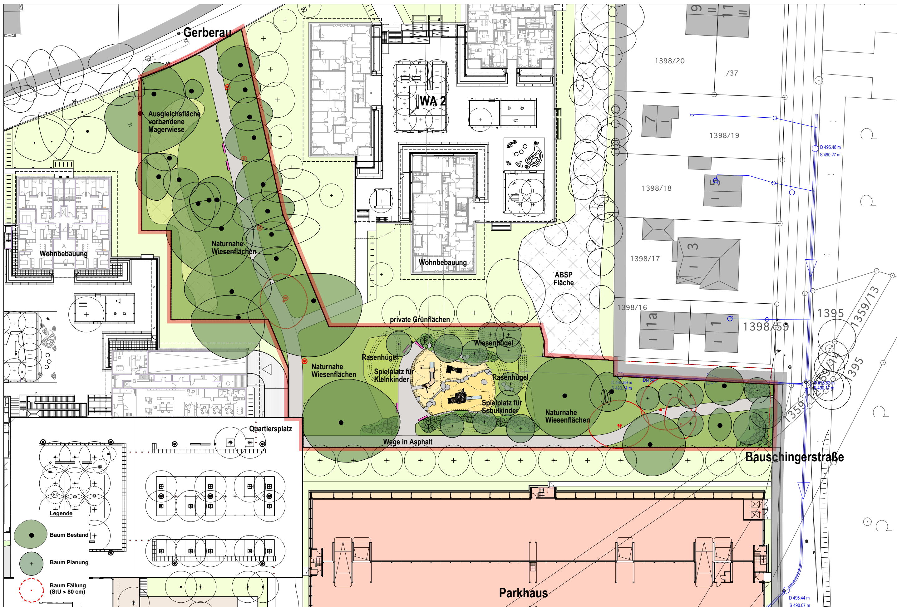
Neubau öffentliche Grünflächen mit Ausgleichsflächen an der Gerberau, Bauschingerstraße und Otto-Warburg-Straße