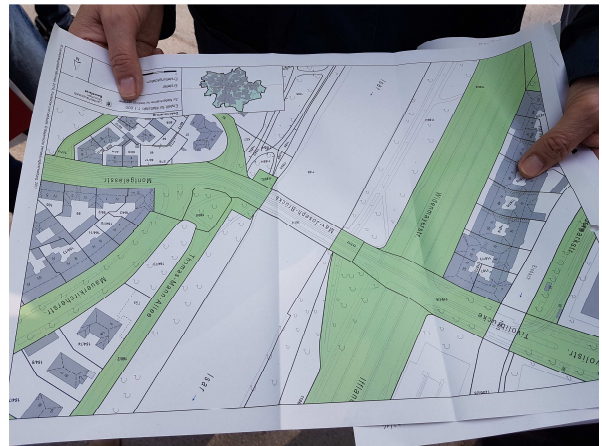
Grün: städtischer Grund Weiß: Grund vom Freistaat Bayern