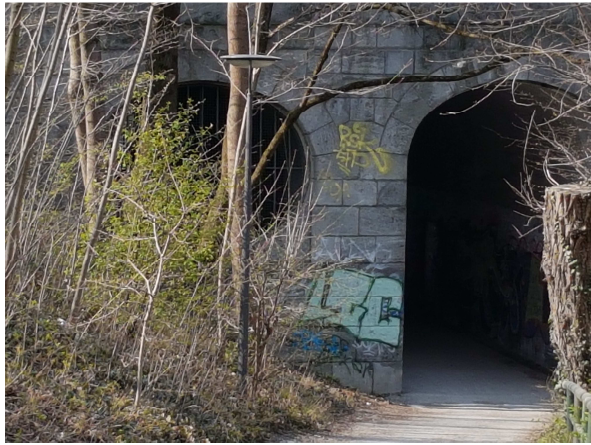
Links verdeckt: Brückenaug Rechts: bestehende Raddurchfahrt

Bilder, die den aktuellen Bestand darstellen (Ansicht von der Thomas-Mann-Allee):