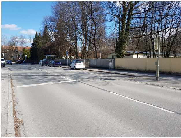
Östliche Straßenseite der Oberföhringer Straße mit bestehenden Längs-Parkplätzen – hier sollen Schrägparker entstehen