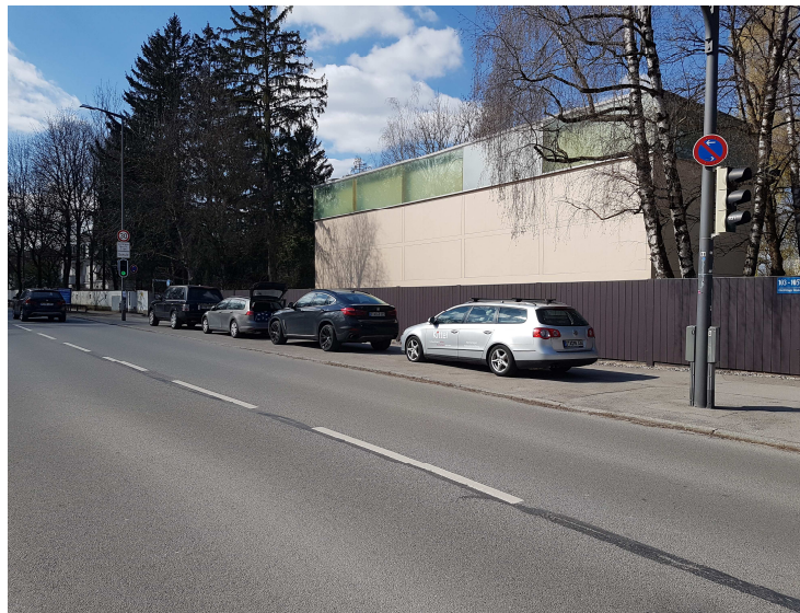
Gehweg gegenüber der Zufahrt zum Bürgerpark Oberföhring (westliche Straßenseite der Oberföhringer Straße)

Schon jetzt von PKW als Parkplätze genutzt.