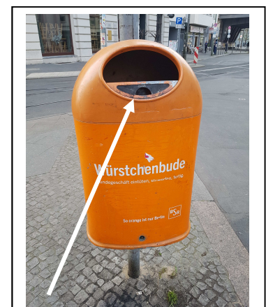
Muster aus Berlin