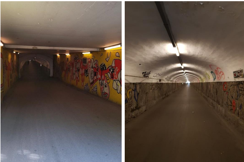
Der Tunnel wirkt düster, die Notrufe sind schwer auszumachen.