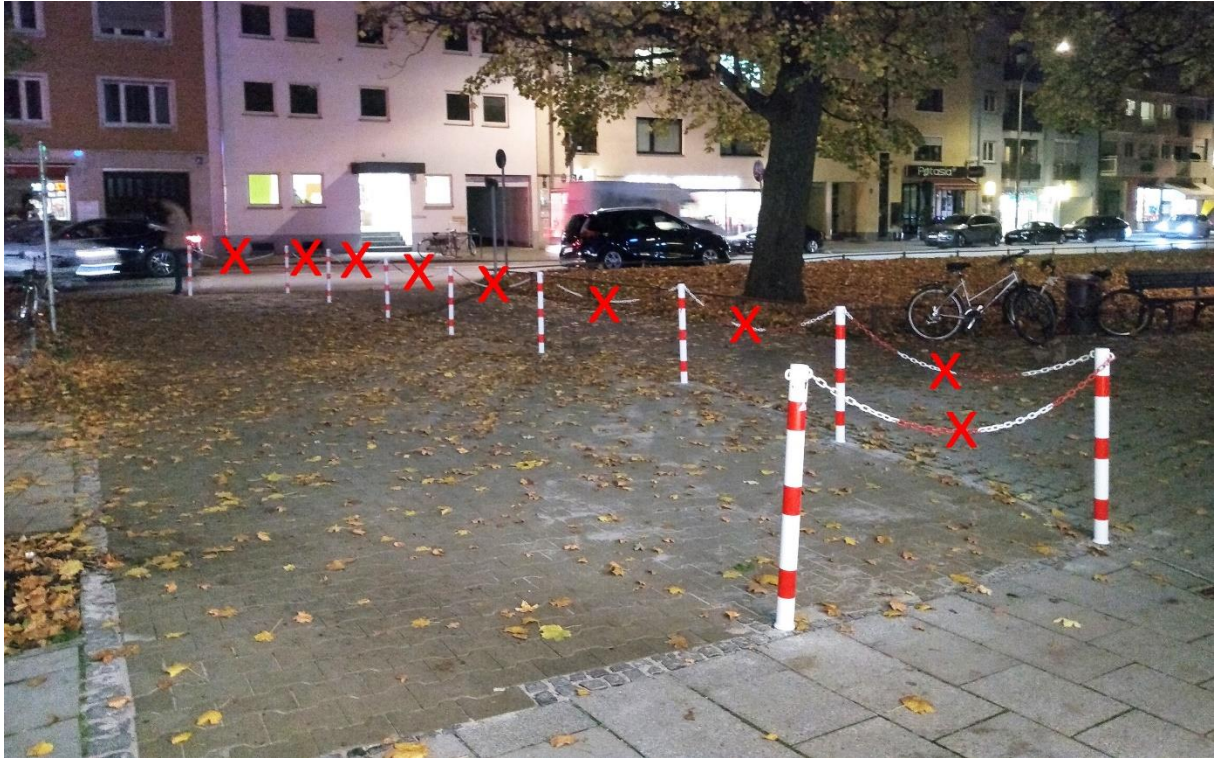
Entfernung der Ketten: Auch ohne die Ketten kann das Befahren durch PKW verhindert werden.