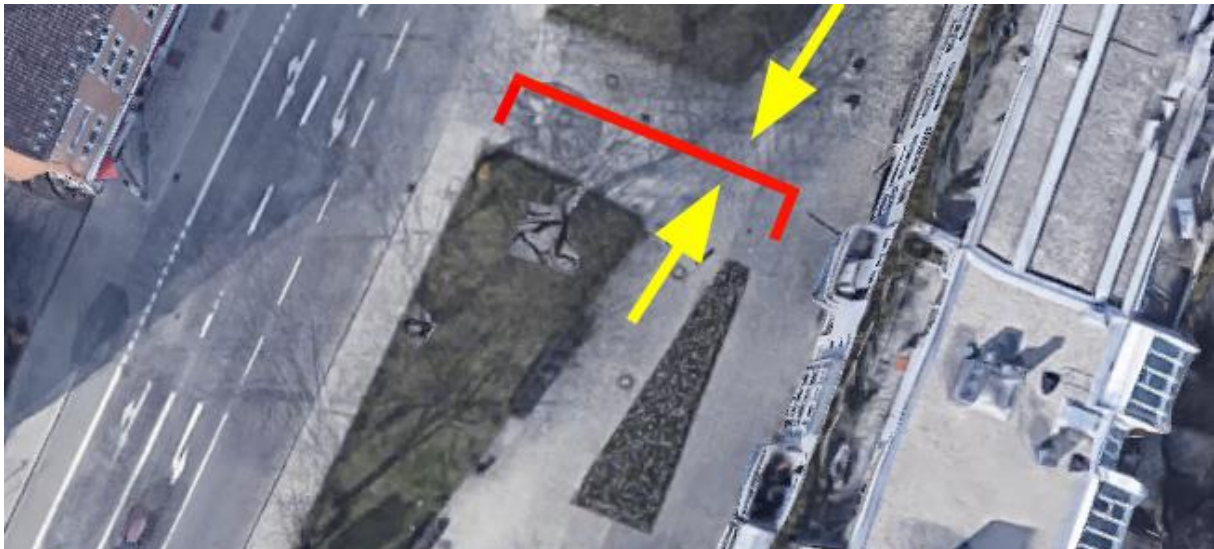
Rot: Lage der Absperrung

Zwar ist der Wunsch des Eigentümers, die Zufahrt vor falsch parkenden Fahrzeugen zu schüt- zen, durchaus nachvollziehbar und zu begrüßen. Nicht nur für gehbehinderte Menschen be- deutet die Absperrung aber einen zusätzlichen Umweg. Auch ist die Absperrung kaum nach- zuvollziehen, nachdem die erst vor wenigen Jahren aus öffentlichen Mitteln hergestellte Wegeverbindung nun dadurch blockiert wird. Die rot-weißen Absperrpfosten beeinträchtigen zudem das Ortsbild im Berg am Laimer Stadtteilzentrum.