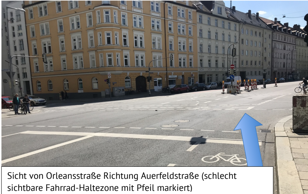
Sicht von Orleansstraße Richtung Auerfeldstraße (schlecht sichtbare Fahrrad-Haltezone mit Pfeil markiert)