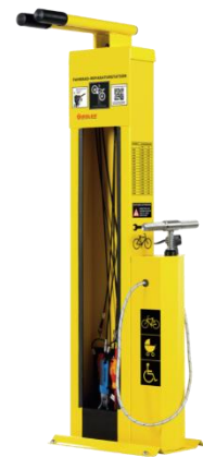
Abbildung 1: Fahrradservicestation beispielhaft

Der zunehmende Fahrradverkehr braucht nicht nur gute und sichere Wege sondern auch ergänzende Infrastruktur um alle Fahrten angenehm zu gestalten. Bei Pannen ist es in München zwar meist nicht weit zum nächsten Fahrradladen, die dankenswerter Weise oft Luftpumpen bereitstellen, aber ob der dann gerade geöffnet hat oder Zeit hat eine Schraube nachzuziehen ist fraglich.