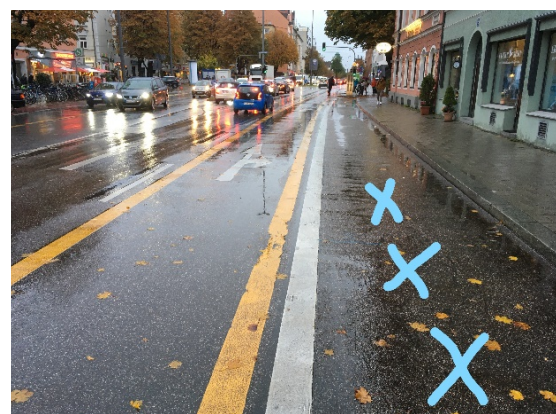
Rosenheimer Straße 63 (Taxistellplätze)