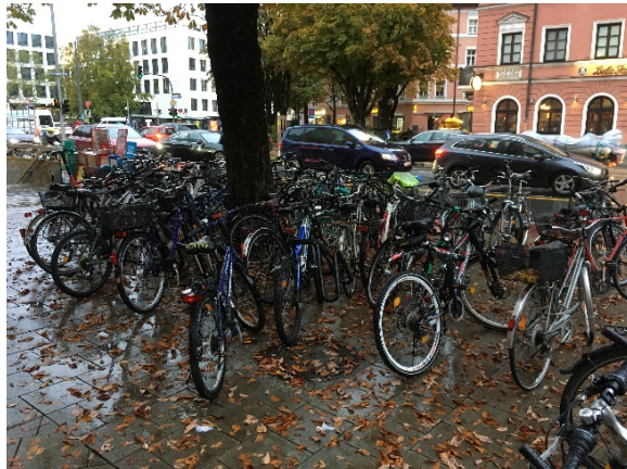
Momentaufnahme am 26.10.2020

im Hinblick auf die derzeitige Pandemie wäre es sehr von Vorteil, wenn Fußgänger*innen durch eine Verlagerung parkender Fahrräder mehr Platz zum Gehen und Ausweichen hätten.