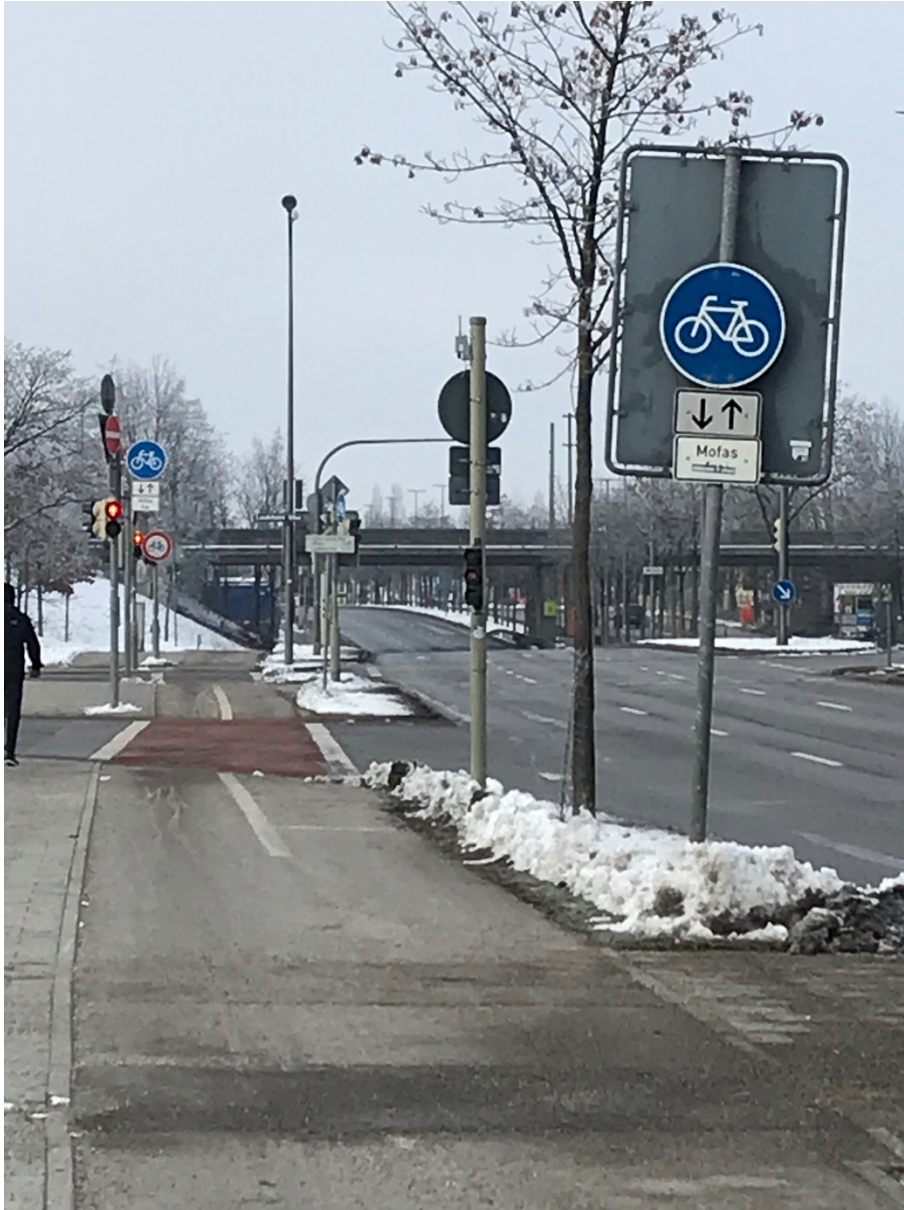
Abbildung 3: Südl. Treibstraße Richtung Westen