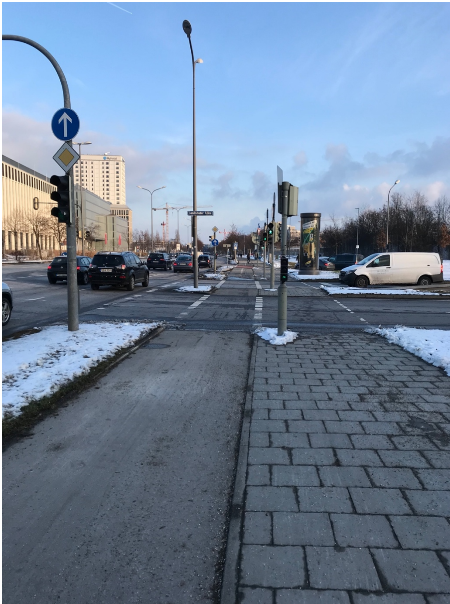
Abbildung 4: Südl. Triebstraße Richtung Osten

Die Fraktionsmitglieder im BA10 FRAKTION BÜNDNIS90/DIE GRÜNEN München, 25.01.2021