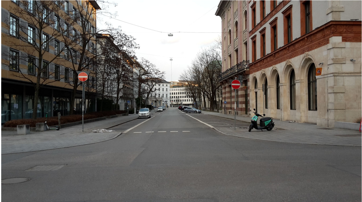
Abb. 1: Einmündung Ottostraße / Max-Joseph-Straße – Einfahrt (ohne Ausnahme) verboten