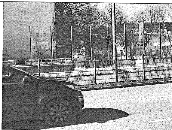
Bestehender Schutz Bereich Pertisaustr.