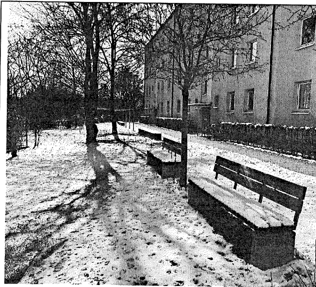
Wohnungsbebauung Ecke Bad-Schachener-Str.