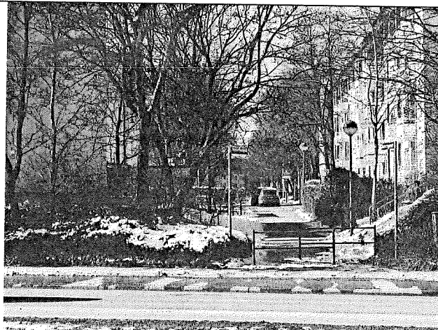
Blick vom Innsbr-Ring Richtung Rupertigastr.