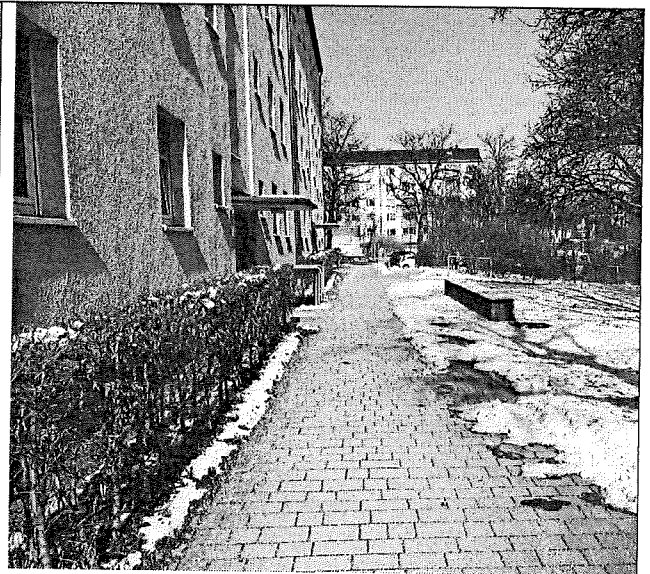
Wohnungsbebauung Ecke Bad-Schachener-Str.