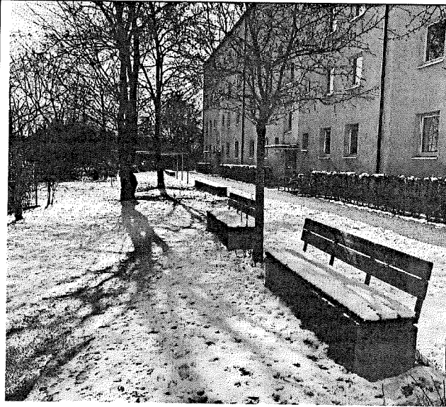
Wohnungsbebauung Ecke Bad-Schachener-Str.