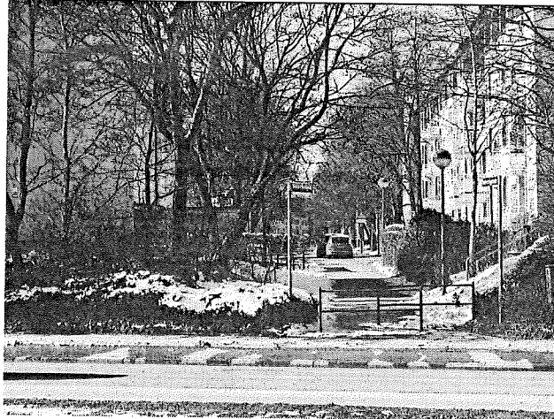
Blick vom Innsbr-Ring Richtung Rupertigastr.