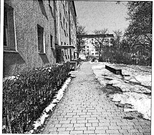
Wohnungsbebauung Ecke Bad-Schachener-Str.