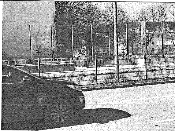
Bestehender Schutz Bereich Pertisaustr.