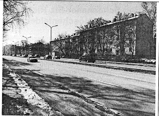
Innsbrucker-Ring Blickrichtung Wohnbebauung