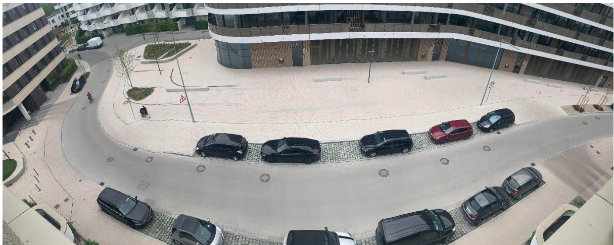
Sicht von oben auf die Hermann-Weinhaus-Straße und den Quartiersplatz.