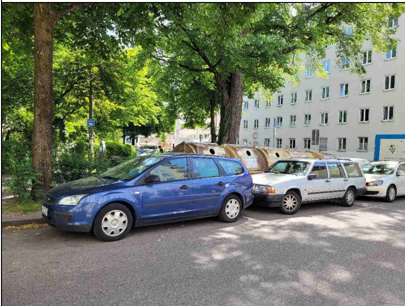
Bild 4 Kein Zugang zu den Containern