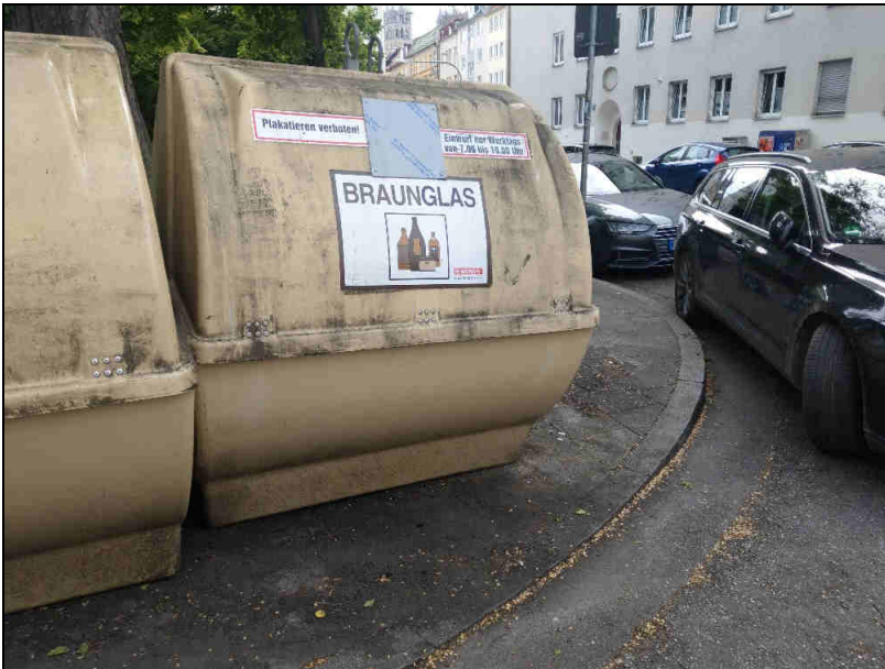
Bild 3 Zu weit in der Passage aufge- stellte Container.