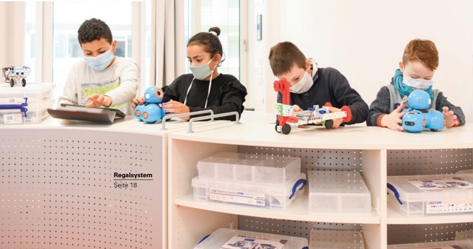
Regalsystem Seite 18