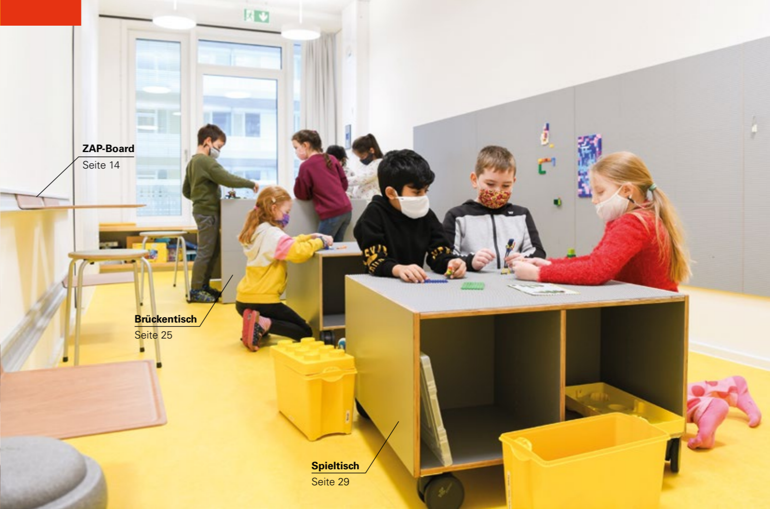
ZAP-Board Seite 14