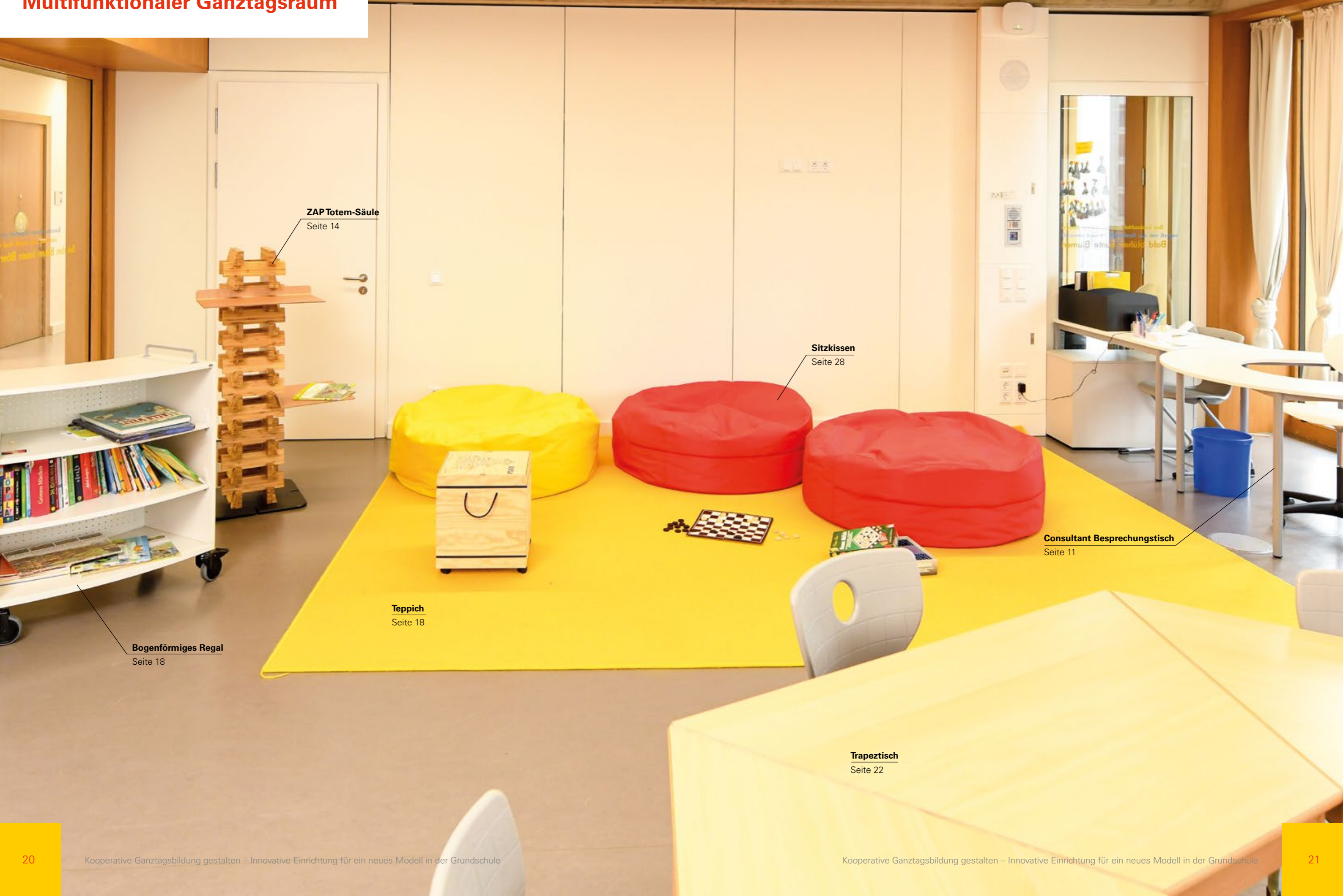
ZAP Totem-Säule Seite 14