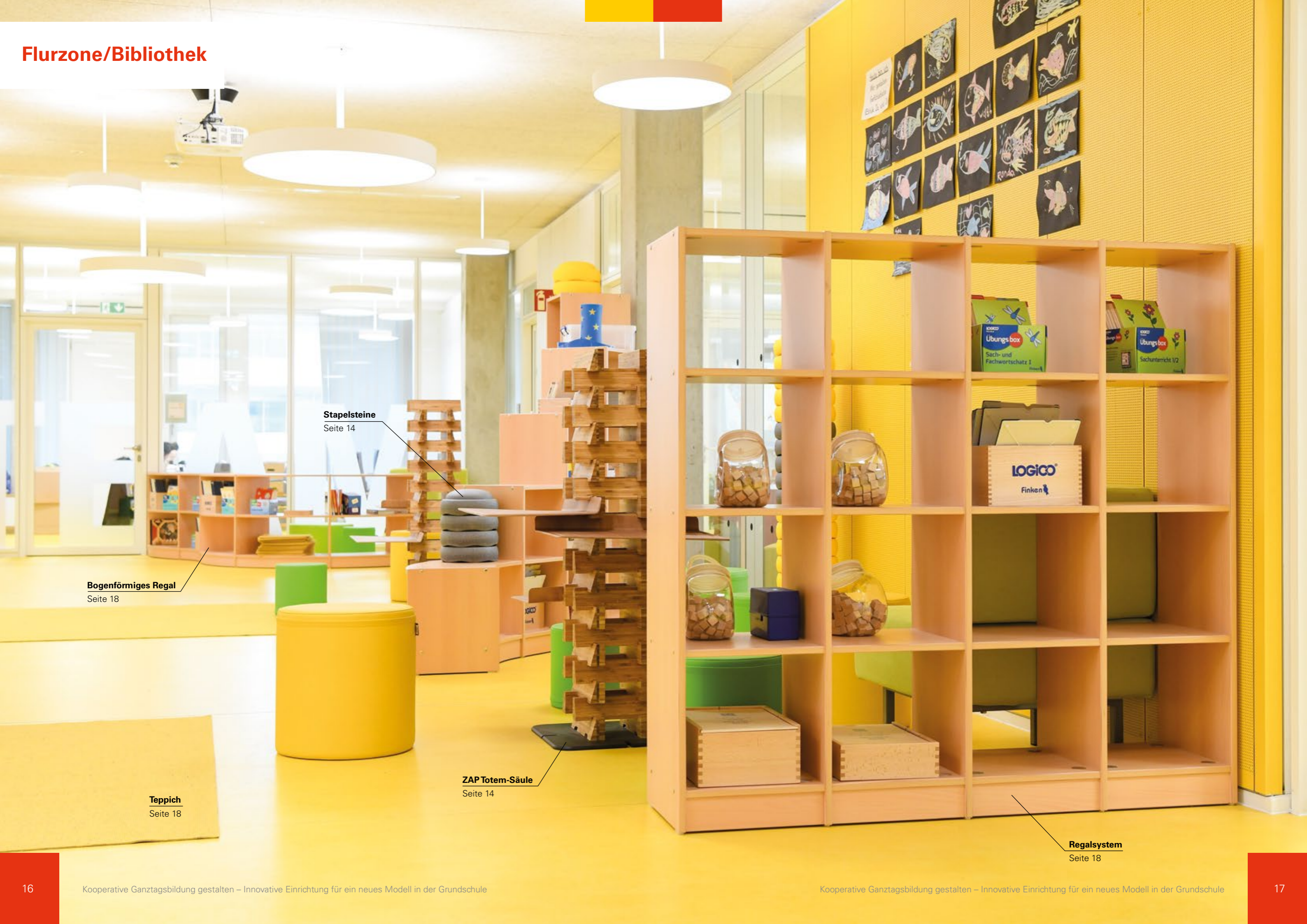
Stapelsteine Seite 14