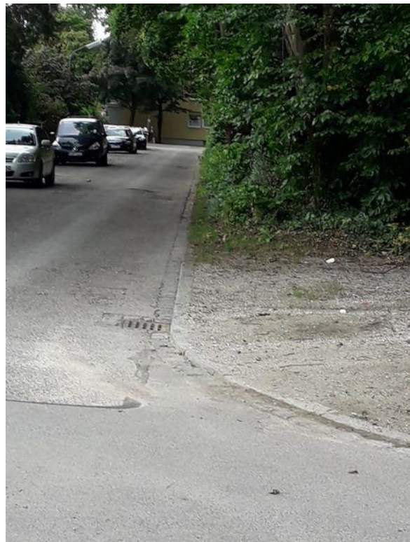
Beispiel 2: Diesterwegstraße, Ecke Valpichlerstraße: Schild und Straßenzustand