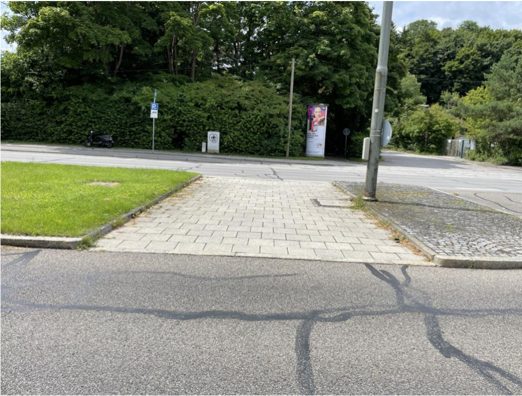
Abb.: Vergleichbarer Übergang Zehntfeldstraße zum Ostpark (komplett ebenerdig)