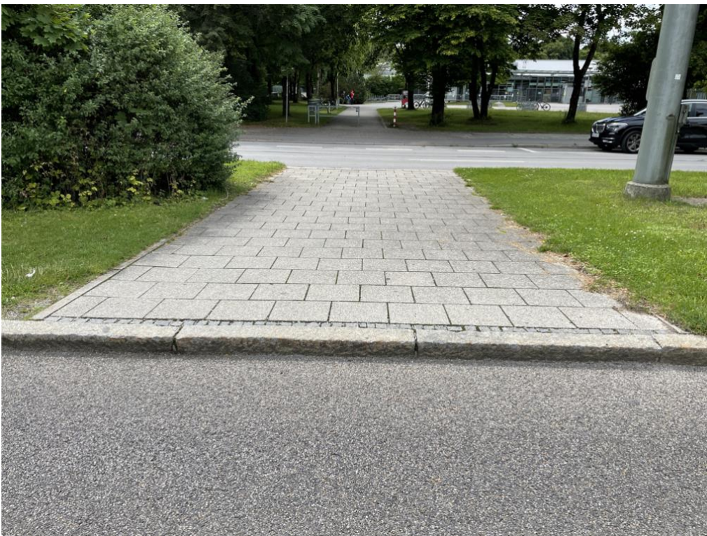
Abb.: bestehender Übergang Michaeliburgstraße zum Michaelibad (mit Schwelle und erhöht)

Der bestehende Übergang hat eine erhebliche Schwelle, die Personen im Rollstuhl, mit Rollator, Kinderwagen o.ä. eine Erreichung der sicheren Mittelinsel erheblich erschweren. Oft kann dort beobachtet werden, dass eine Person bei einer herannahenden Welle von Autos Schwierigkeiten hat, auf die Mittelinsel zu kommen, was zu lebensgefährlichen Situationen führt.