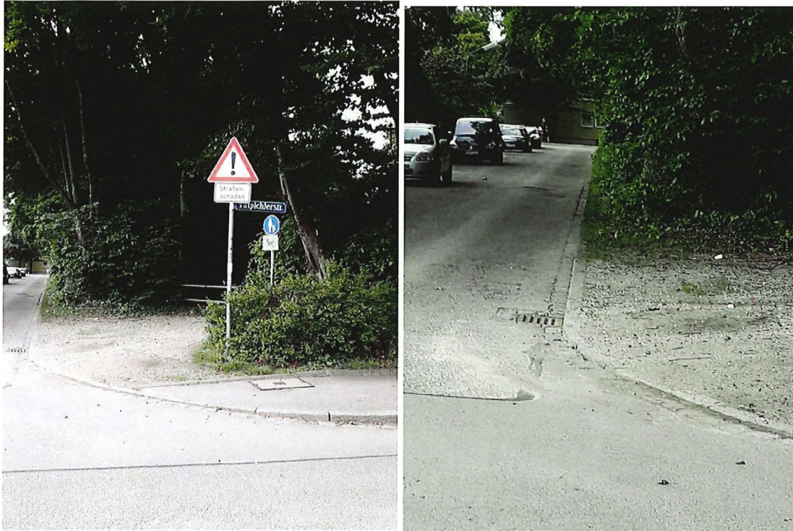
Beispiel 2: Diesterwegstraße, Ecke Valpichlerstraße: Schild und Straßenzustand