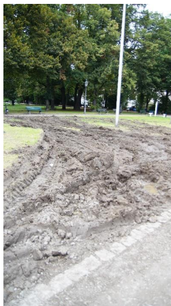
Schäden an den Grünflächen am Königsplatz