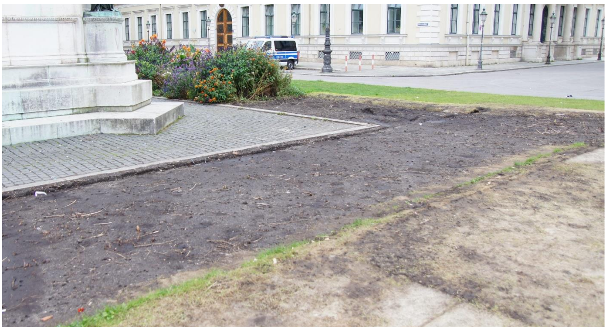
Schäden an der Grünfläche am Reiterdenkmal