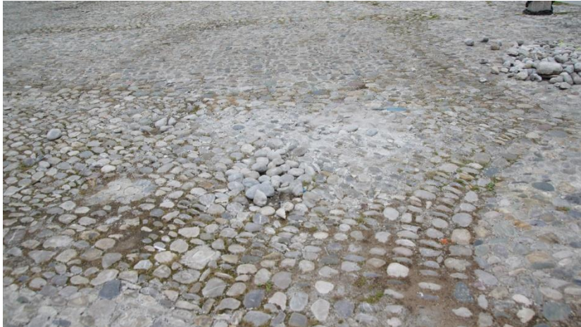
Schäden am Pflaster auf dem Max-Josef-Platz