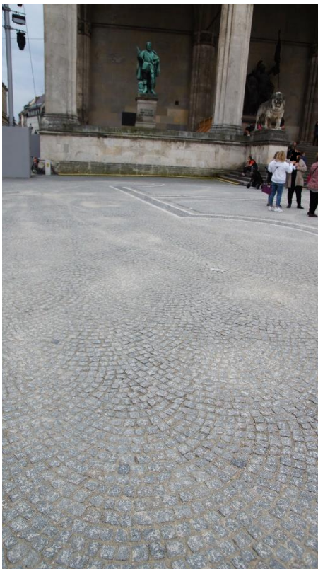
Schäden am Pflaster des denkmalgeschützten Odensplatz