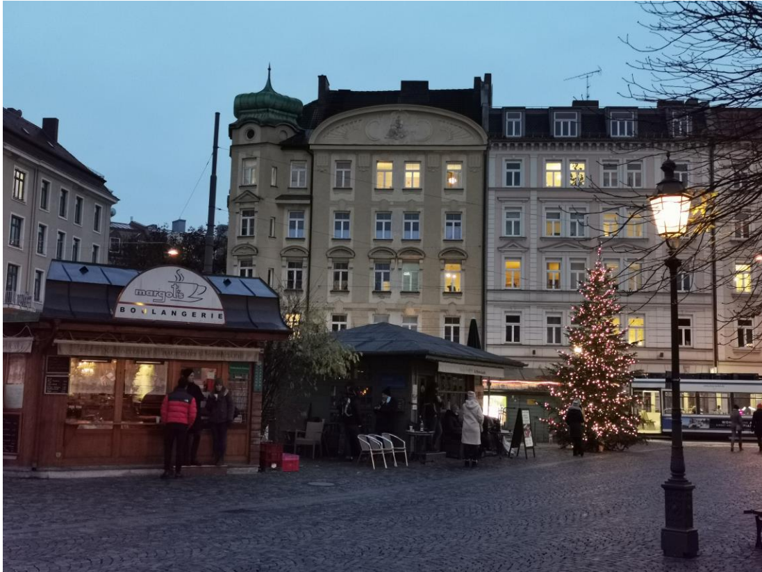
Weihnachtsbaum 2020 am Wiener Platz