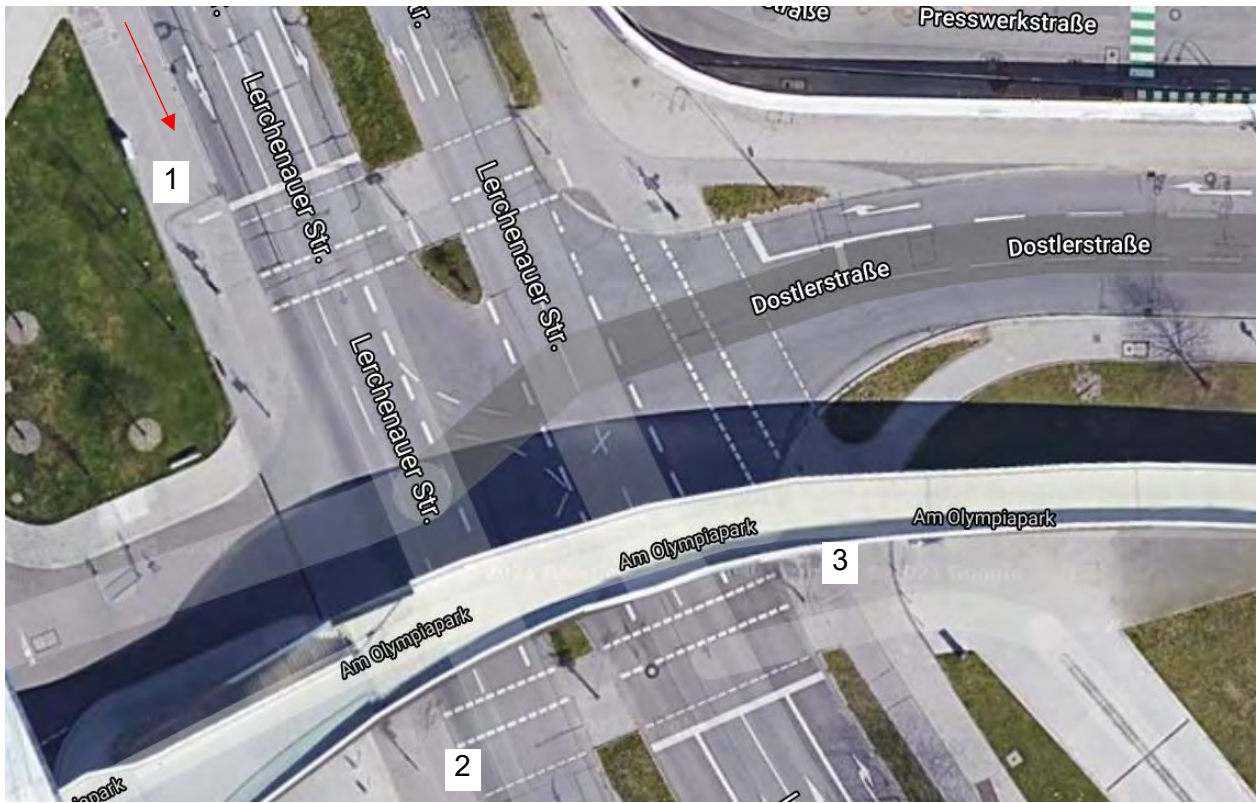
Abbildung 1: Haltepunkte, an denen Radfahrende warten müssen, um von Norden aus links in die Dostlerstraße einbiegen zu können (Satellitenbild aus Google Maps)