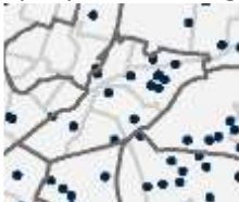
Spielplätze für Jugendliche: