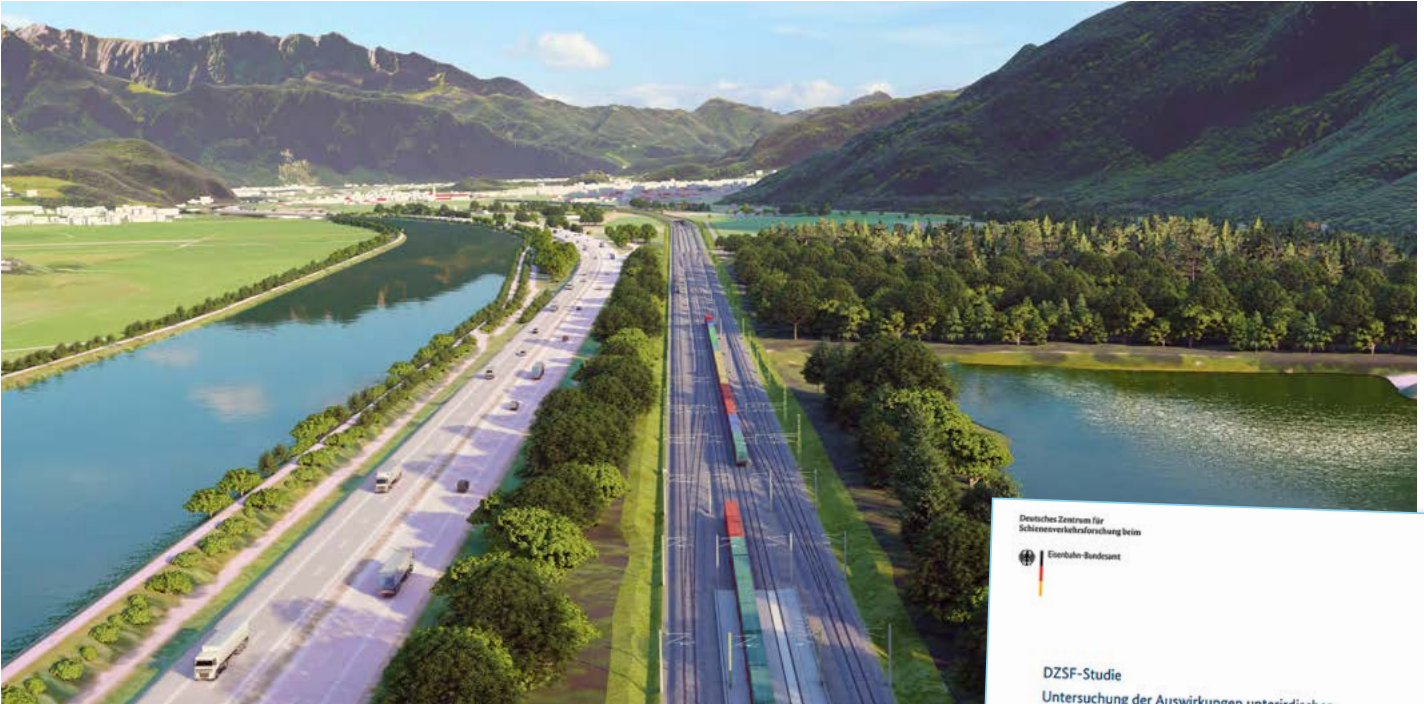
Geplante Verknüpfungsstelle neben der Inntalautobahn: In der Vorplanung soll eine Optimierung geprüft werden

Fragestellungen verbunden. Deren Analyse würde einen beträchtlichen Aufwand an Zeit und Kosten verursachen. Dabei gäbe es keine Garantie, dass diese Untersuchungen erfolgreich abgeschlossen und darauf basierend die entsprechenden Genehmigungen durch das Eisenbahn-Bundesamt erteilt werden können. ■