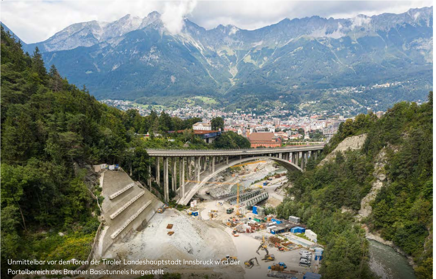
Unmittelbar vor den Toren der Tiroler Landeshauptstadt Innsbruck wird der Portalbereich des Brenner Basistunnels hergestellt