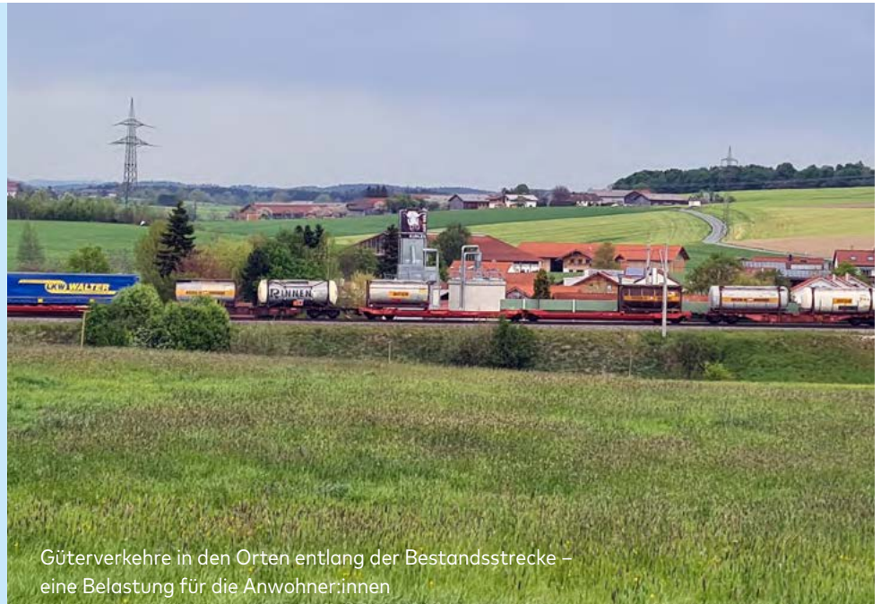
Güterverkehre in den Orten entlang der Bestandsstrecke – eine Belastung für die Anwohner:innen