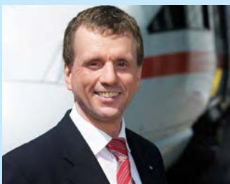
Klaus-Dieter Josel Konzernbevollmächtigter der DB für den Freistaat Bayern

Mit diesem Rückenwind wird die Bahn in diesem Sommer vorstellen, welche Streckenführung im Abschnitt Grafing–Ostermünchen am geeignetsten erscheint. Manche Fragen können bis dahin geklärt werden, ganz ohne Konfliktstellen wird es aber nicht gehen. Die Rahmenbedingungen, die der Bundesverkehrswegeplan vorgibt, lassen planerisch nur wenig Spielraum. Wir suchen nach geeigneten Lösungen gemeinsam mit den Menschen der Region.