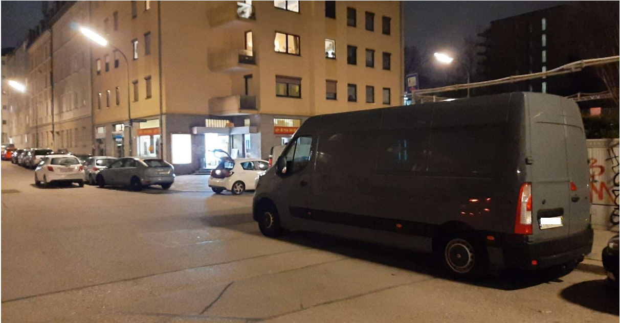
Fehlende Übersichtlichkeit an der Kreuzung Leiparstr. /Bauernbräuweg