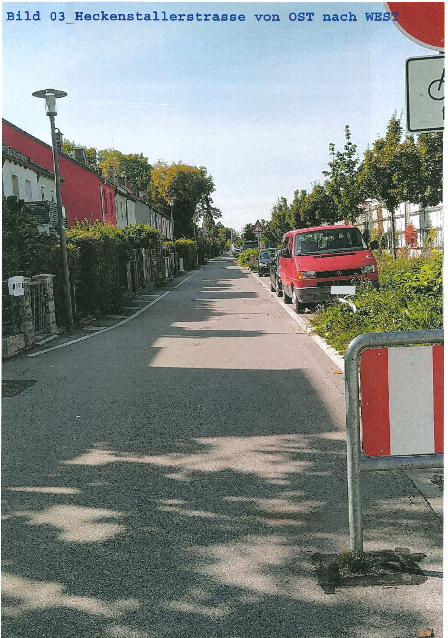
Bild 03_Heckenstallerstrasse von OST nach WEST