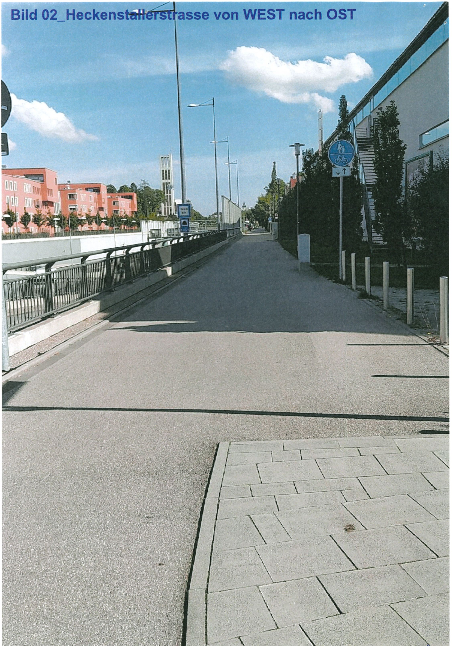
Bild 02_Heckenstallerstrasse von WEST nach OST

Handwritten signature or mark in blue ink.