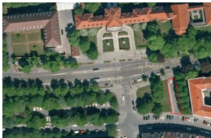
Abbildung 2: Satellitenbild Kölner Platz https://geoportal.bayern.de/bayernatlas