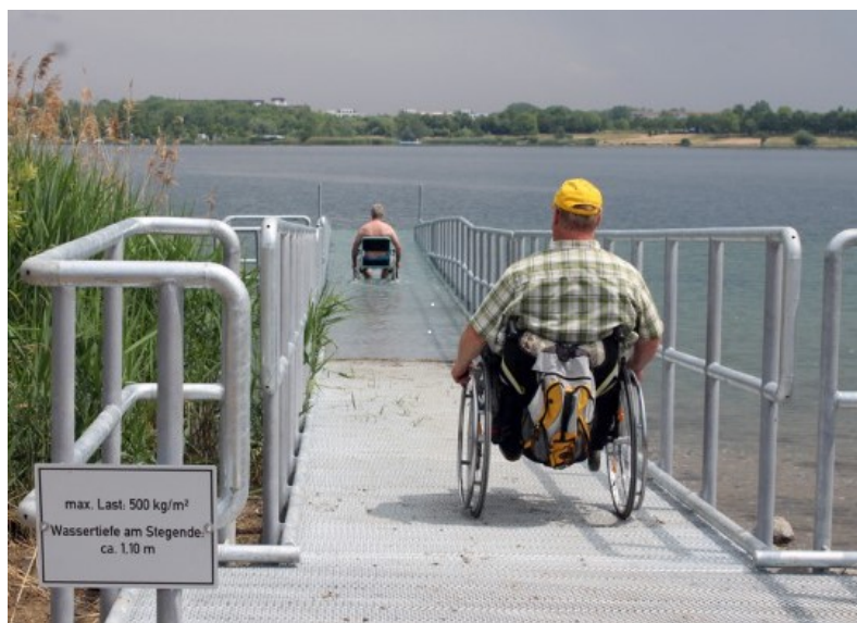
Foto: Stadt Markranstädt - Kulkwitzer See – Barrierefreier Badesteg