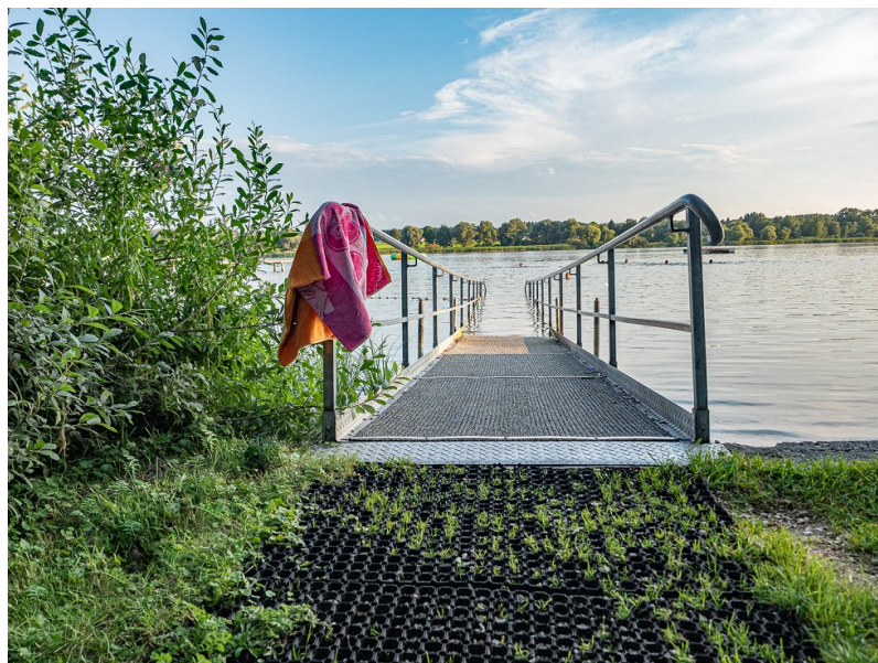
Obinger See - https://www.urlaub-in-obing.de/barrierefreier-urlaub/