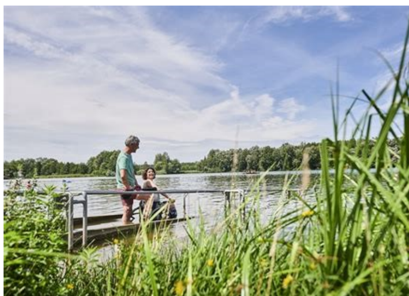
Fränkisches Seenland- https://www.seenland-barrierefrei.de