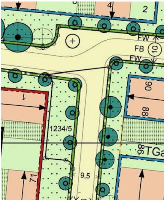
Abbildung 4: Der Bebauungsplan zeigt auch für den südwestlichen Bereich der Kreuzung einen sicheren umlaufenden Bürgersteig.