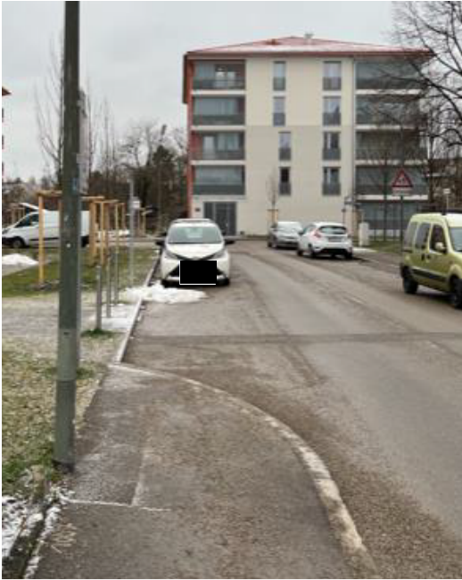
Abbildung 1: Blick aus südlicher Richtung – der Bürgersteig endet einfach und die Fußgänger*innen werden in den Straßenbereich geführt.