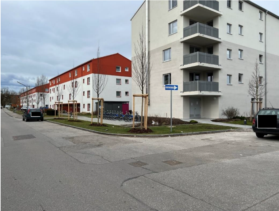
Abbildung 3: Blick auf den Kreuzungsbereich mit dem fehlenden Bürgersteig.