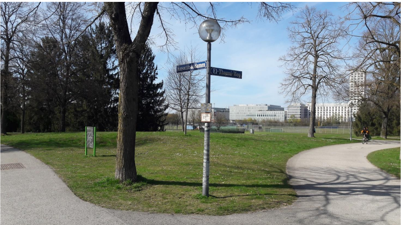
6 Der Scheideweg: Richtung Olympia-Pressesstadt oder U3 Oberwiesenfeld? Trefferquote: 50%! Und Kunst im Park: Umgestaltetes Grünanlagenschild im Niemandsland ...