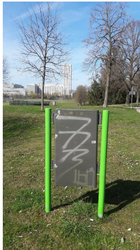
2 Grünanlagenschild mitten im Park - statt sonst am Parkeingang: Aber was will uns der Künstler sagen?