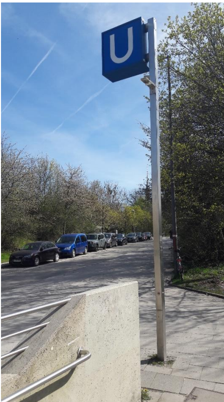
1 Ausgang U-Bahn-Station Oberwiesenfeld: Wo geht's hier bitte zum Olympiapark?