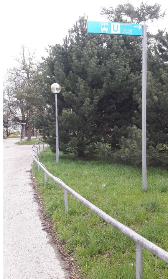
12 Und hier ein ganz neues Schild: Ästhetik sehr gelungen, nur ohne Fernbrille schwer zu lesen. Wie wäre es mit weniger blauer Leerfläche links und größerer Schrift rechts?