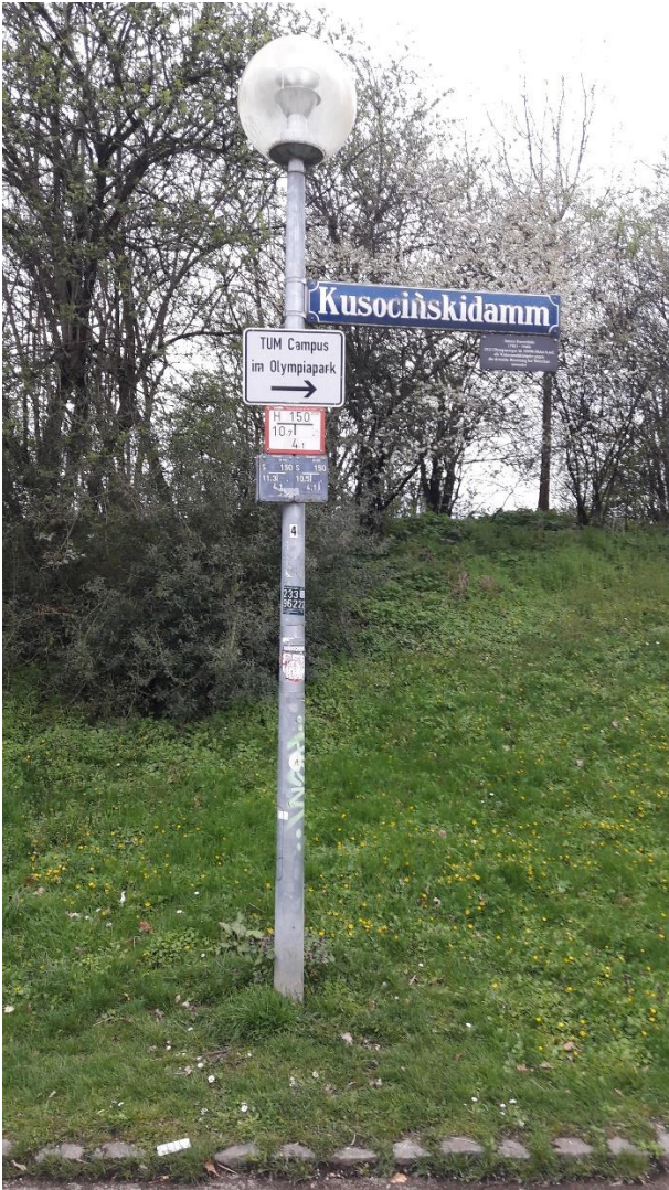
11 Tatsächlich: Ein Hinweisschild im Nordteil des Olympiaparks! Das Gestaltungshandbuch Olympiapark war aber noch unbekannt.