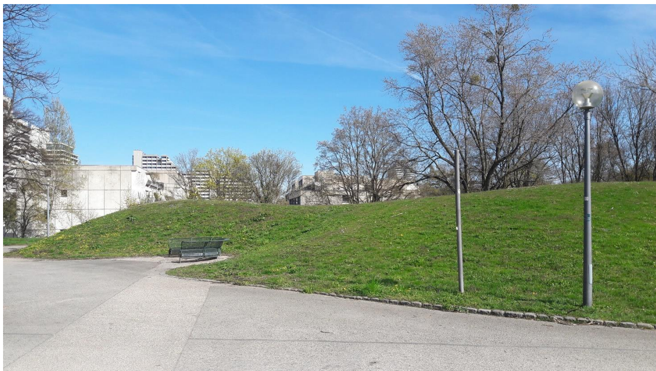
7 Verwaister Schildermast am Kusocińskidamm auf Höhe Connollystraße: 1972 gab es hier noch Hinweisschilder für Parkbesucher – und blühende Rosen.