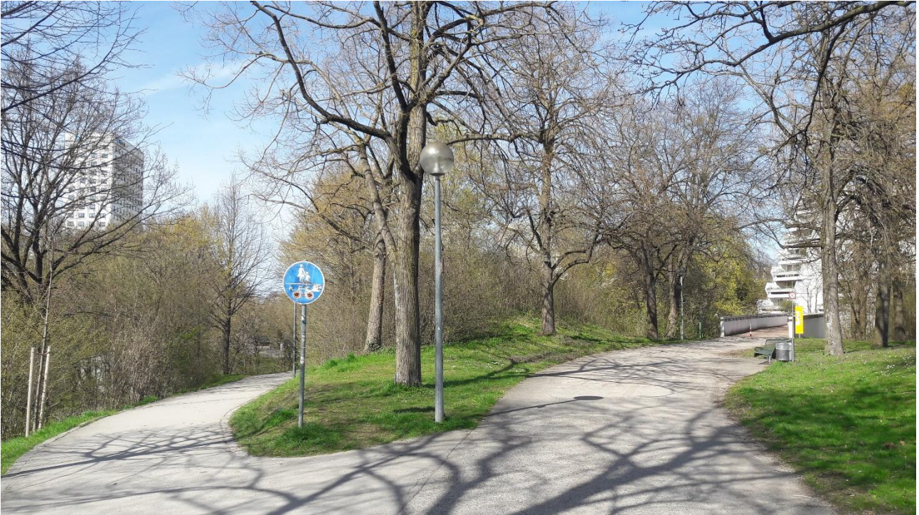
5 Weggablung El-Thouni-Weg: Wo geht's hier bitte zur U3 Oberwiesenfeld?