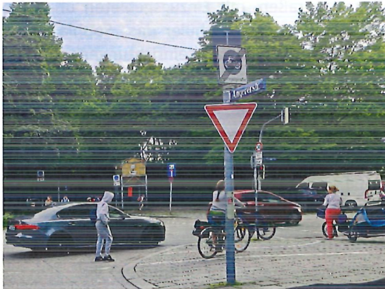
Abbildung 3: Zu wenig Aufstellfläche: Bereits mit einem Fahrrad mit Kinderhänger wird der Radweg in Ost- West Richtung behindert.