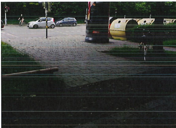
Abbildung 5: vgl. Abbildung 3 und 4, auch auf der gegenüberliegenden Straßenseite blockiert schon ein einzelner Radfahrer die Durchfahrt durch das Aufstellen am Grünsignal Bedarfstaster.