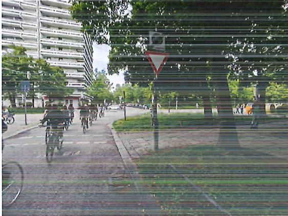
Abbildung 1: Radverkehrsaufkommen