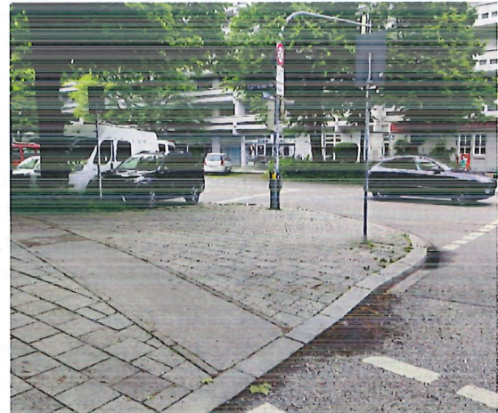
Abbildung 4: Zur Nutzung der Grünsignalanforderung muss der Radweg gequert und Gehweg als Aufstellfläche genutzt werden.