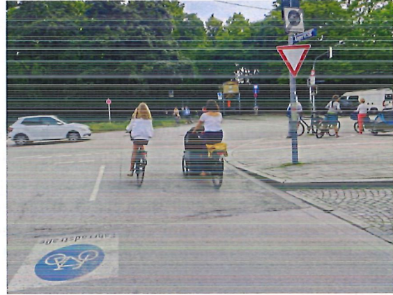
Abbildung 2: Querung bei Kfz-Verkehr