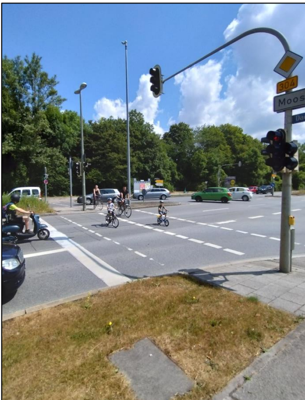
Abbildung 4: Westliche Radverkehrs-furt, von Süd-westen aus gesehen