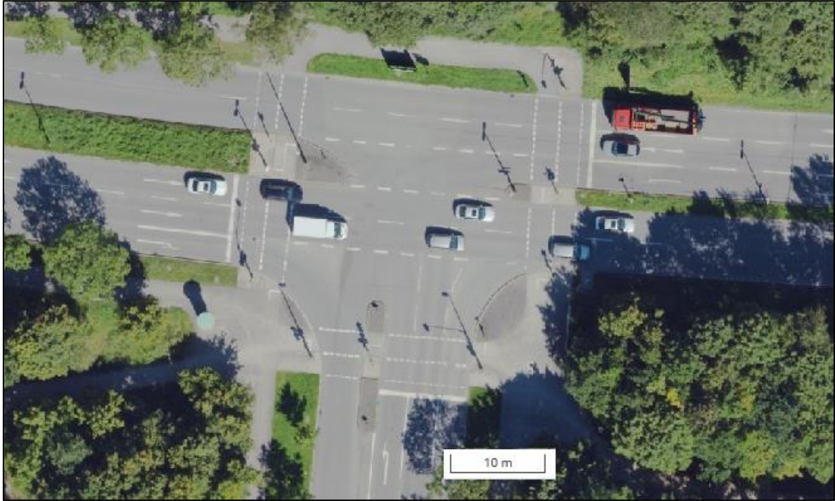
Abbildung 2: Luftbild