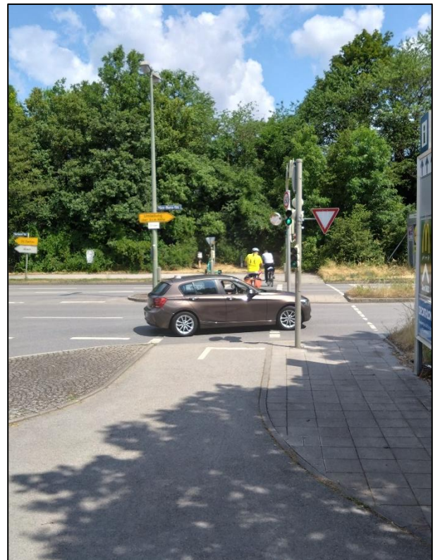
Abbildung 5: Östliche Radverkehrs-furt, von Sü-den aus gesehen