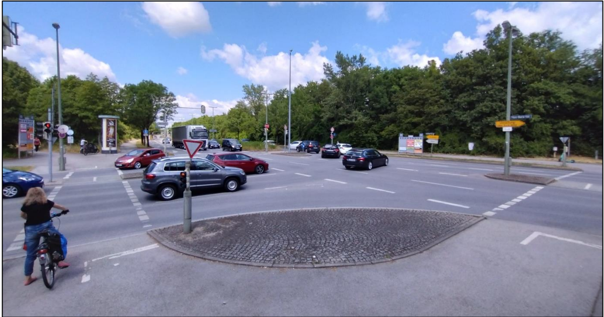
Abbildung 3: Kreuzungsbereich Dachauer Str. / Max-Born-Str., Perspektive von Südost nach Nord-west, in Blickrichtung Dachau