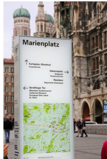
Manche kennen so etwas bereits aus anderen Städten. Jetzt hat auch München Infostelen.