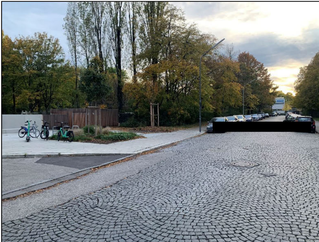
Abbildung 3: Postillonstraße, Blick Richtung Homerstraße/Dantefreibad, zur linken Hand der Eingangsbereich des städtischen Haus für Kinder Postillonstraße 11a