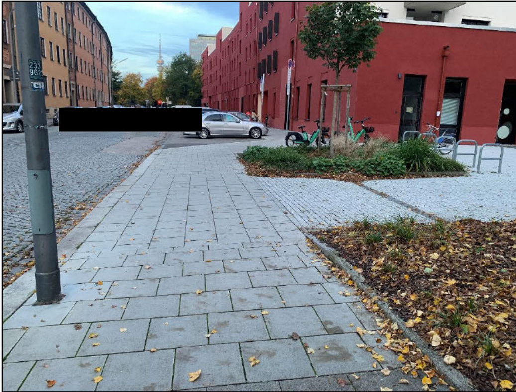
Abbildung 2: Postillonstraße, Blick Richtung Dachauer Straße, zur rechten Hand der Eingangsbereich des städtischen Haus für Kinder Postillonstraße 11a