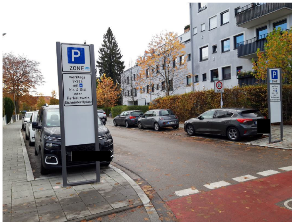
Eichendorffstrasse / Albert-Rosshaupter-Strasse