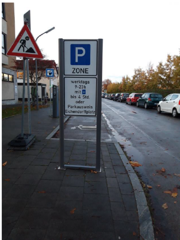
Eichendorffplatz / Johann-Clanze-Strasse (westlich)

→ Parklizenzschilder stehen in einer Flucht mit Parkplätzen, der Gehweg ist nicht verengt