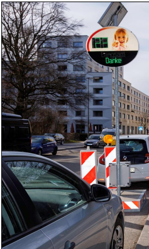
Abbildung 2: Dialog-Display, Welfenstraße, Januar 2024

Die Fraktionsmitglieder im BA10 FRAKTION BÜNDNIS 90/DIE GRÜNEN München, 15.02.2024