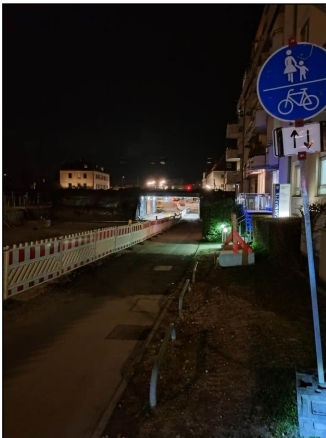
Abbildung 2: Abschnitt des provisorischen Geh- und Radwegs von Riesengebirgstr. in Richtung Nord-west bis Eisenbahnüberführung